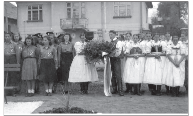
Kladením vencov si pamiatku padlých v II. sv. vojne uctili v Batizovciach aj v roku 1950.