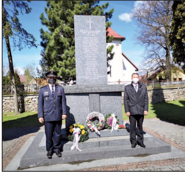
Skončenie II. svetovej vojny si v obci uctili položením vencov k pamätníku v obmedzenom režime.

Milan Lasica pri jednej príležitosti povedal, že „keď žijeme v slobode, tak si ju ani neuvedomujeme“. Je to presne tak, ako keď prirodzene vdychujeme vzduch, ktorý je okolo nás. Napriek tomu však treba o slobodu dennodenne bojovať.“ Pietnym aktom polozenia vencov k pamätníku padlým sme si aj v našej obci pripomenuli okrúhle 75. výročie ukončenia druhej svetovej vojny a 78. výročie od deportácie židovských občanov z Batizoviec. Aj naša obec, v ktorej žijeme, priniesla počas vojny drahé obete obyčajných ľudských životov. Niektoré mená zdobia náš monumentálny pamätník, ktorý sa hrdlo vypína v parku pred obecným úradom. Ale koľko padlých hrdinov je takých, o ktorých nevieme alebo sa nespomínajú. Všetkým patrí vďaka za túto prinesenú obeť. Obet najdrahšiu. Obet ľudského života. Tohto roku si pripomínáme aj 70. výročie od slávnostného odhalenia nášho krásneho pomníka padlým. Slávnosť sa konala 14. mája 1950 v nedeľu za účasti predstaviteľov obce, cirkvi, hasičov ako aj obyvateľov. Pri našom pomníku sa pravidelne schádzame dvakrát do roka. Priamych účastníkov a pamätníkov z roka na rok ubúda. Preto má naša generácia zodpovednú úlohu si tieto pamätné dni – 8. máj ukončenie druhej svetovej vojny a 29. august Slovenské národné povstanie, pripomínať, aby sa vojna v našich dejinách už nikdy neopakovala.