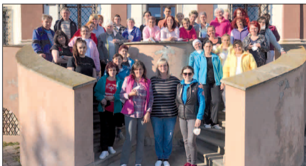
... a konečne po v CSS Domov pod Tatrami v Batizovciach.