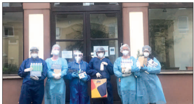
Kolektív zamestnancov počas karantény...